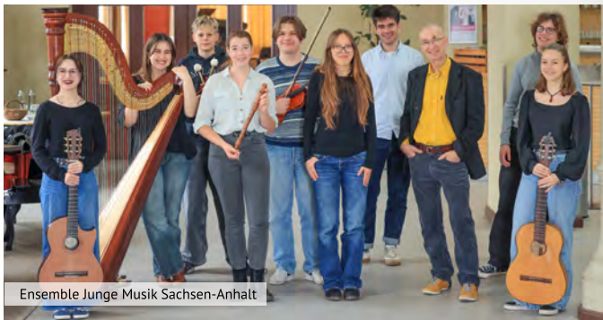
Ensemble Junge Musik Sachsen-Anhalt