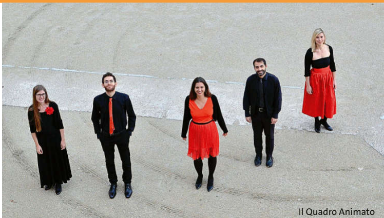
Il Quadro Animato

Sonntag / 07.04.2019 / 11.00 Uhr / Schinkelsaal 562. Sonntagsmusik